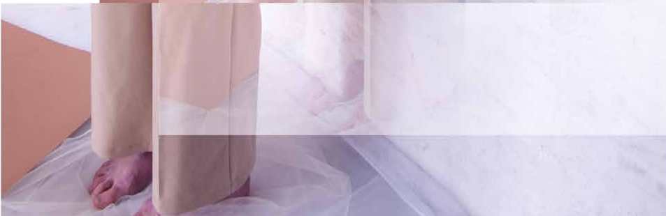
Deeldood | Het deel van jezelf dat met het verlies gestorven is.