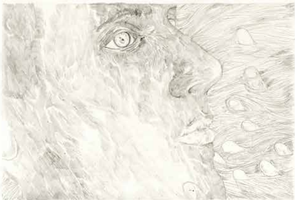
om zich om te keren