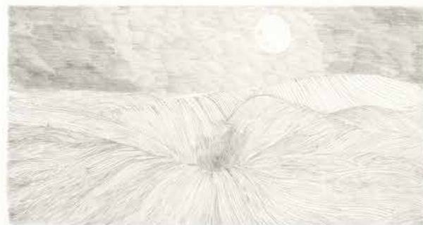
wanneer hij, in de stilte van de maan,