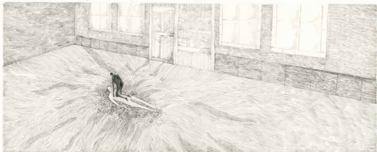
is het omdat hij in zijn bed van steen,