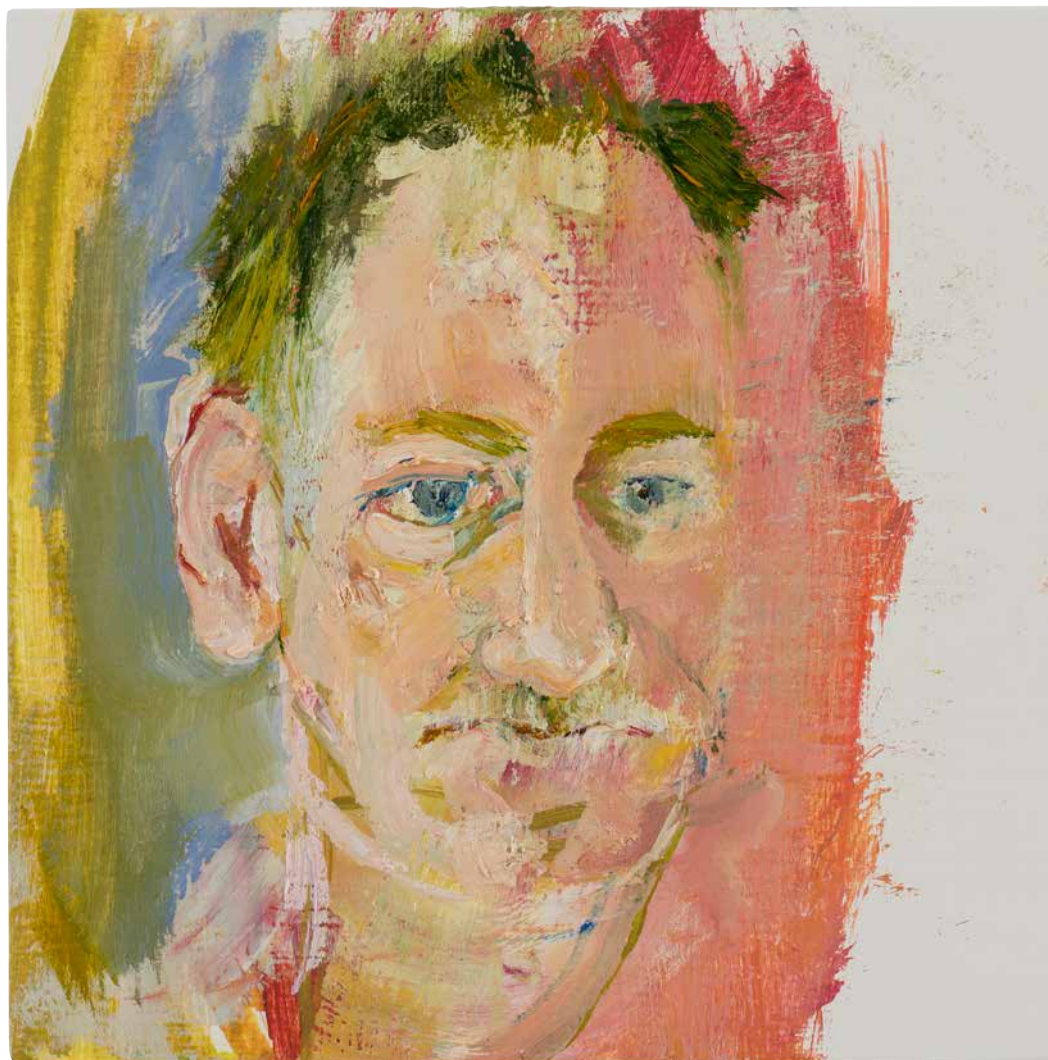
© Henk Hage, TrA 3 (Triangulum Australe/Zuiderdriehoek), olieverf op paneel