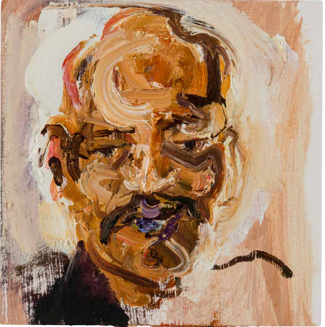
© Henk Hage, Leo 2 (Leo/Leeuw), olieverf op paneel

Vanwege de anonimiteit van de geportretteerden kon de kunstenaar geen namen of initialen gebruiken. Het aantal portretten, achtentachtig, komt overeen met het aantal sterrenbeelden op de hemelkaart. Elk portret kreeg als titel de afkorting van een sterrenbeeld.