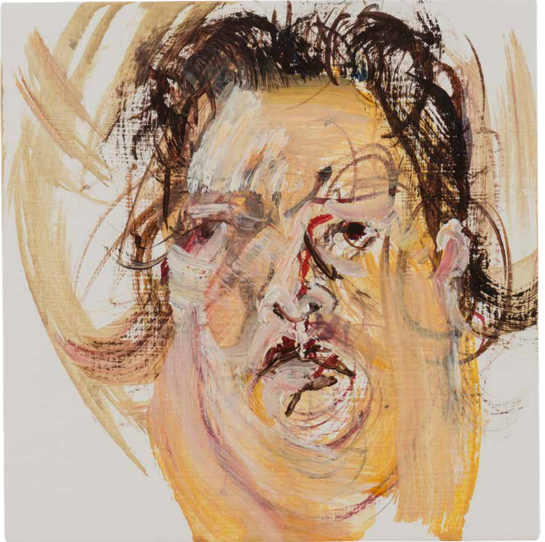
© Henk Hage, For 3 (Fornax/Oven), olieverf op paneel