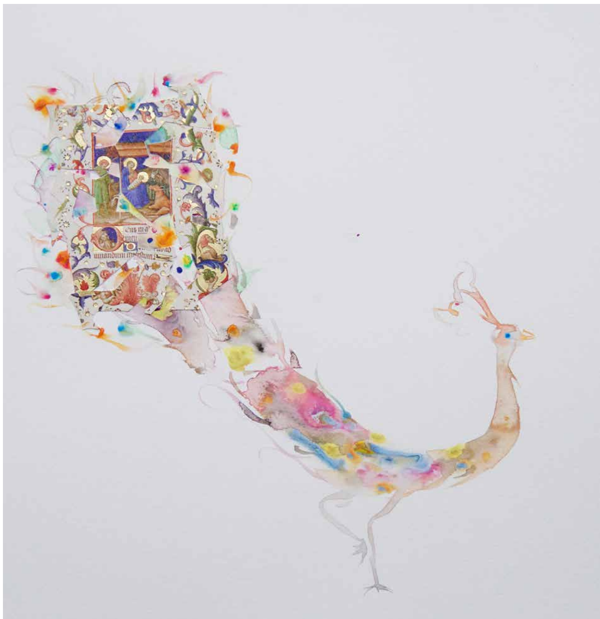
© Marc Mulders, Pauw met Maria met kind in de staart , 2009, aquarelverf op papier.