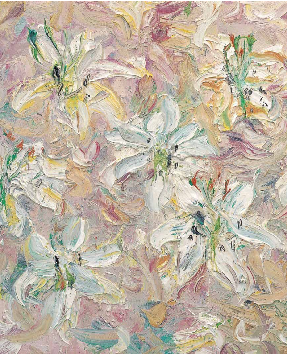
© Marc Mulders, Kleine lilies , 1997, olieverf op doek.