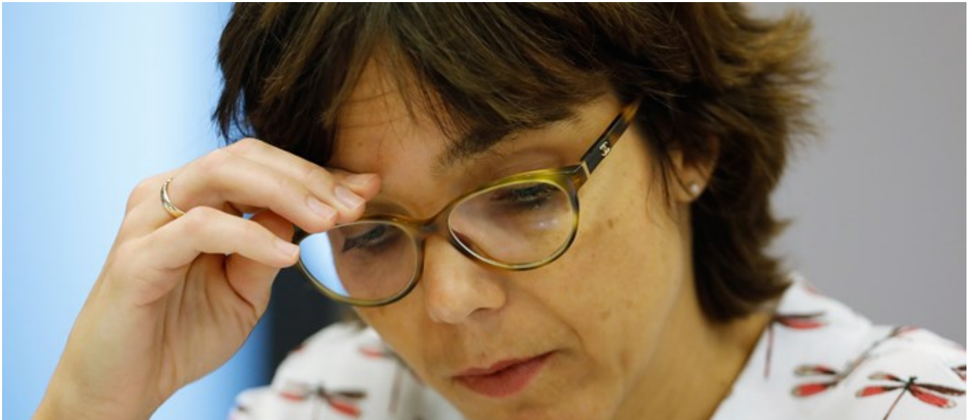
Carla Dik, Kamerlid voor de ChristenUnie