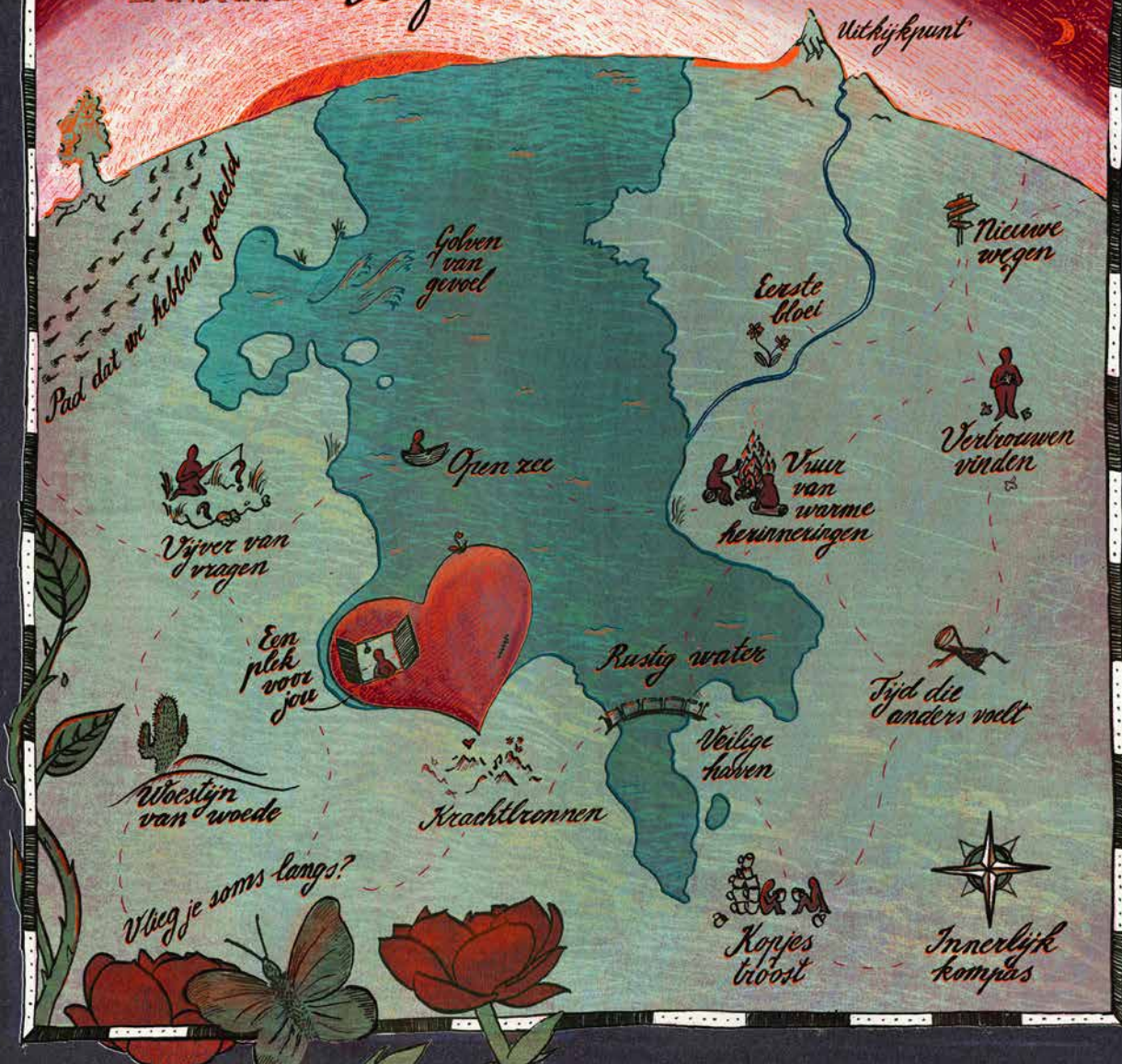
Landkaart liefde en verlies (troost- of gesprekskaart)

Pen en inkt op papier, digitaal bewerkt en gecombineerd met texturen.