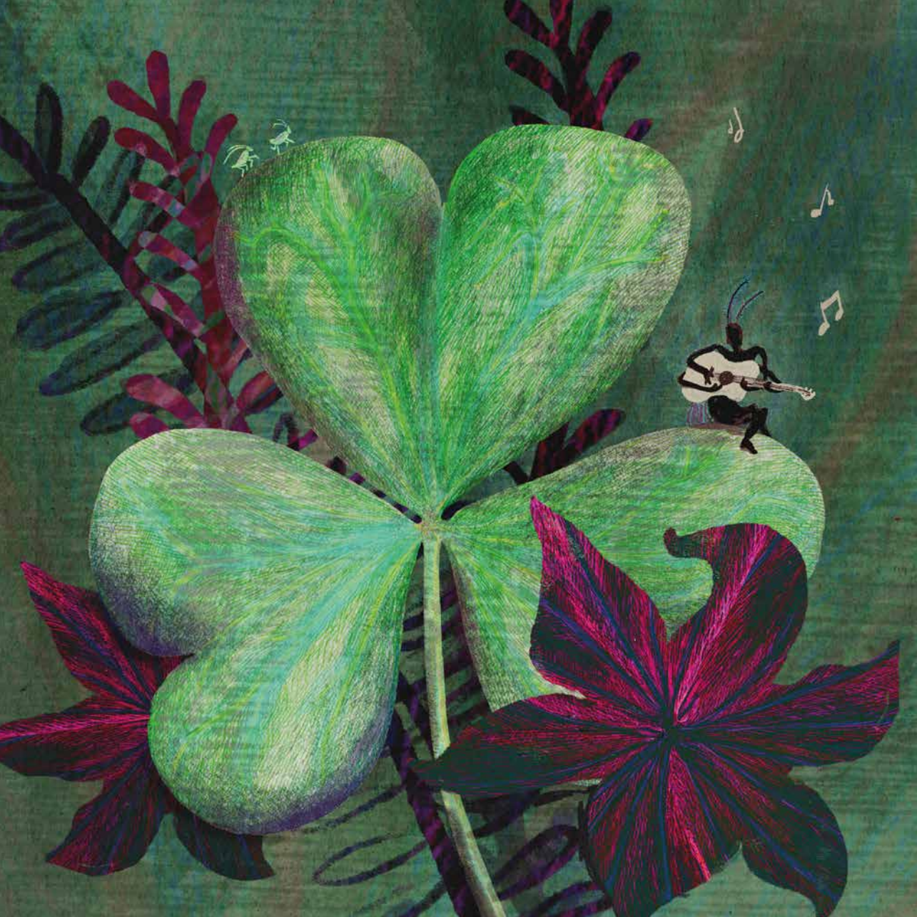
Klaver (kaart om iemand een hart onder de riem te steken) Pen en inkt op papier, digitaal bewerkt en gecombineerd met texturen.